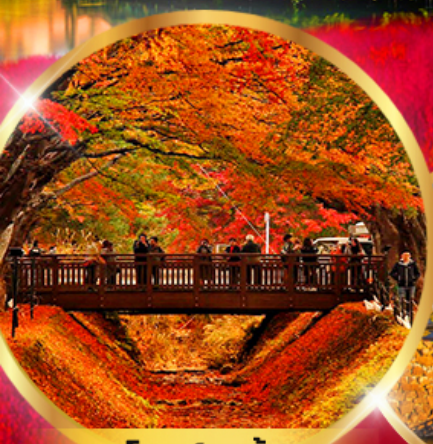
อุโมงค์เมเปิ้ล