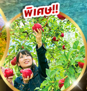
บพพีต์แอปเปิล