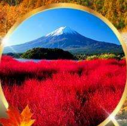
โออิชิ พาร์ค