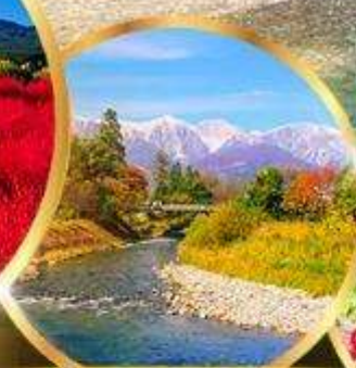
โออิตะ พาร์ค