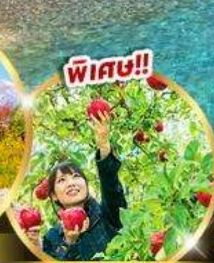
บฟเฟต์แอปเปิล