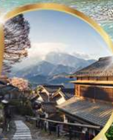
มาโกเมะจุกุ