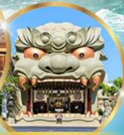
ศาลเจ้านิมะ ยาชากะ