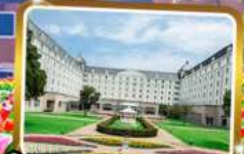
พัก Hotel Nikko Huis Ten Bosch ★★★★★