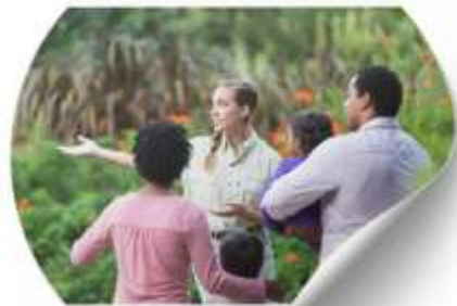
ซื้อทัวร์เสริม