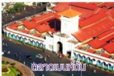
ตลาดเบนห์กั๊ป