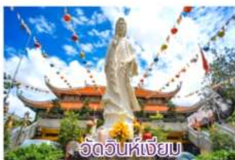
วัดอินห์เจียม