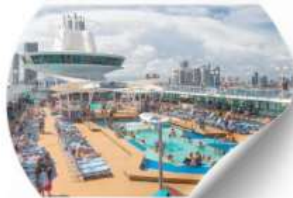
พักผ่อนบนเรือ