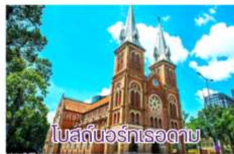
โบสถ์นอร์ทเรอดาม