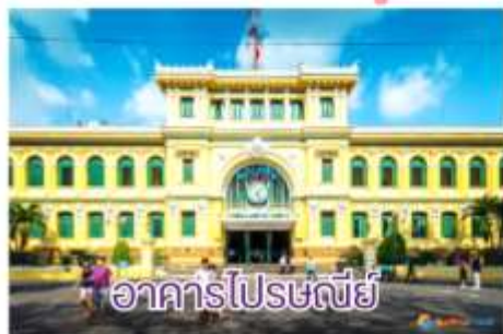
อาคารไปรษณีย์