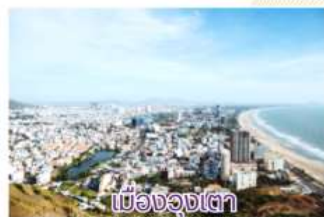
เมืองลุงเตา