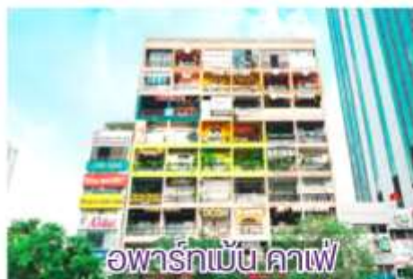
อพาร์ทเมนท์ คาเฟ่