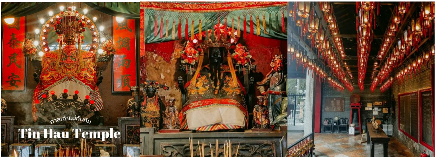
Tin Hau Temple

นำท่านเดินทางสู่ วัดหวังต้าเซียน หรือวัดห้วงไท่ซินในสำเนียงกวางตุ้ง เป็นวัดที่มีอายุกว่าครึ่งศตวรรษ รายล้อมด้วยอาคารที่พักอาศัยของการเคหะ ตัววัดมีความงดงามด้วยอาคารที่ตกแต่งแบบจีนโบราณ ตั้งอยู่บนไหล่เขาเกาลูน เป็นวัดที่ชาวฮ่องกงเชื่อว่ามีศักดิ์สิทธิ์ และเป็นศูนย์รวมแห่งความเชื่อทางศาสนาถึง 3 ศาสนาด้วยกัน ได้แก่ เต๋า พุทธ และขงจื้อ ในแต่ละวันจะมีผู้คนหลังไหลมาราบไหว้ตลอดเวลา โดยเฉพาะนักท่องเที่ยวที่มาเพื่อสักการะขอพรจากท่านมหาเทพ นอกเหนือจากการมาท่องเที่ยวที่นี่