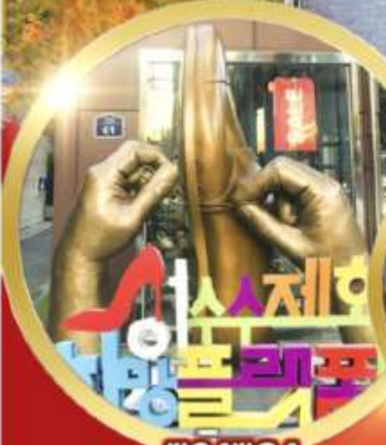
ซองชูดง วอร์ดกึ่งสตรีท