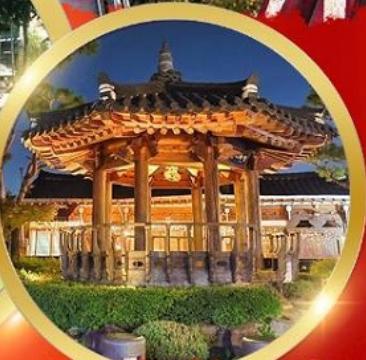
Jeonju Hanok Village