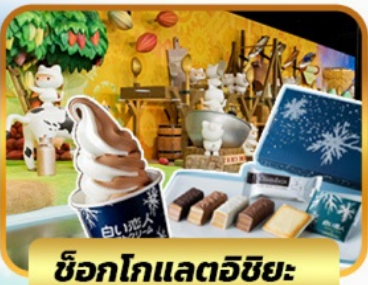
ช็อกโกแลตชิชิ