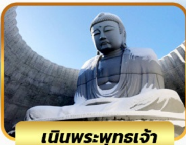
เป็นพระพุทธรเจ้า