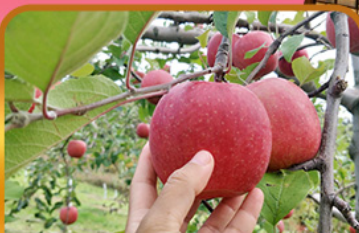
เก็บแอปเปิ้ล