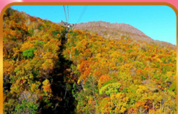
นั่งกระเช้าอุซุซัง