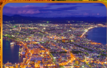
ชมวิวดาโกดาเตะ