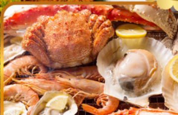
บั้งย่างร้านดังนั้นตะ