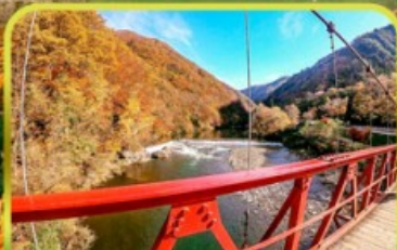
หุบเขาดาคิกาเอริ