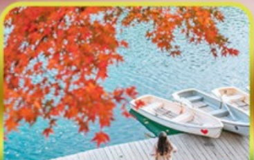
ทะเลสาบโกชิคิคุมะ