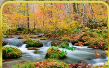
ลำธารโออิราเสะ