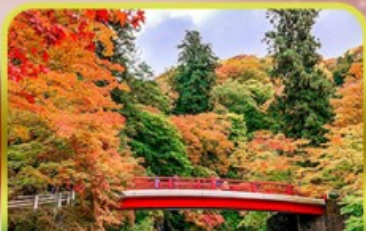
นากาโนะโมมิจิ