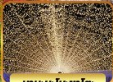
นาบะนะโนะซาโตะ

โอเอซิสวอเตอร์พาร์ค อุโมงค์แปะก๊วยฮิโองามิกิ เทศกาลประดับไฟอุโมงค์ใบไม้แดง บุฟเฟ่ต์ซาบูยักซ์ หมู่บ้านอียาชิโนะซาโตะ ช้อปปิ้งชินจูกุ กินซ่า โอโดบะ ฟรีเดย์ โตเกียว 1 วัน