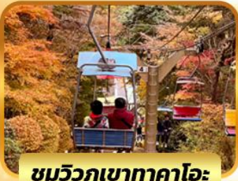
ชมวิวกุเขาทาคาโอะ