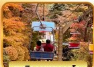
ชมวิวกุเขากาตาโอะ