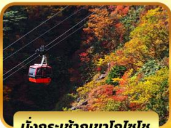
นั่งกระเช้าภูเขาโทไซโซ