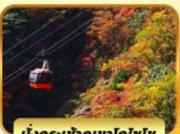
นั่งกระเช้าภูเขาโทโชไซ