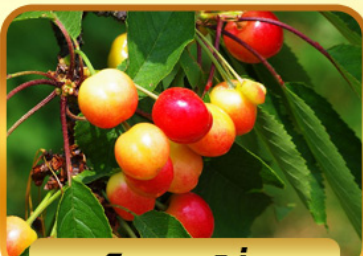
เก็บเชอร์รี่