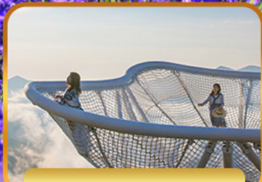
TERRACE OF FROST TREE