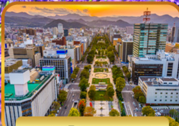
ฟรีเดย์ซิปโปโร 1 วัน