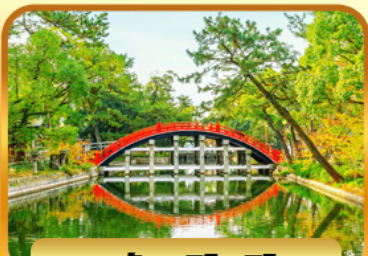
ศาลเจ้าสุมิโยชิโทกะ