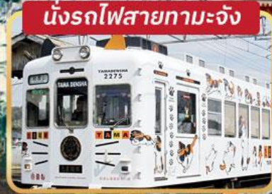
นั่งรถไฟสายทามะจัง