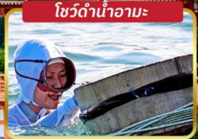
โซว์ดำน้ำอามะ