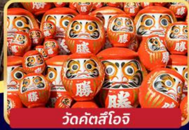
วัดคัตสึโงจิ