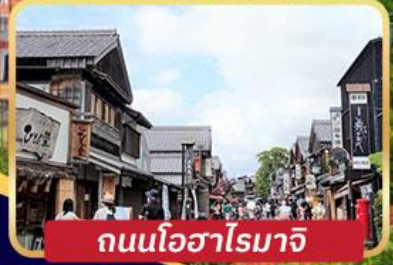
ถนนโอซากาโรมาจิ

สุกี้เนื้อมิตรชิซากะ ข้าวปลาดิบนานาชาติ อาหารทะเล ณ AMA HUT