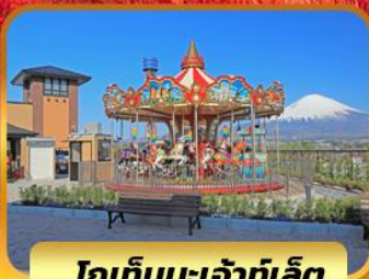
โกเท็มปะเจ้าที่เลิศ