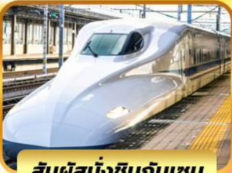
สัมผัสนั่งชินกันเซน