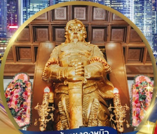
เทพเจ้าเขangkงหมิว (วัดเขangkงหมิว)

จัดเต็มทั้งสายบุญ + สายช้อปปิ้ง ไหว้พระเสริมดวง หมุนกังหันนำโชค วัดเขangkงหมิว นมัสการเจ้าแม่กวนอิมสองสำ • ขอกุ้วัดหวังต้าเซียน • ไหว้พระใหญ่ไป่วหลิน ช้อปปิ้งย่านจิมซาจุ่ย • ซิติ้เทก เอาท์เล็ต • ถนน LADY MARKET • วิกตอเรียพีค