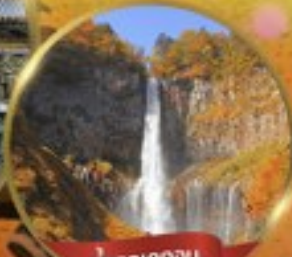
น้ำตกเคกอน