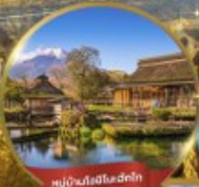
หมู่บ้านโงอิโนะฮะซึกะ