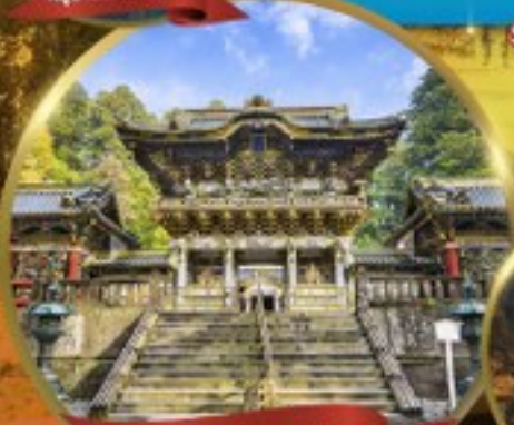
ศาลเจ้านิกโกโทโทกุ