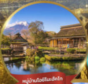
หมู่บ้านโฮชิโนะซากิโก