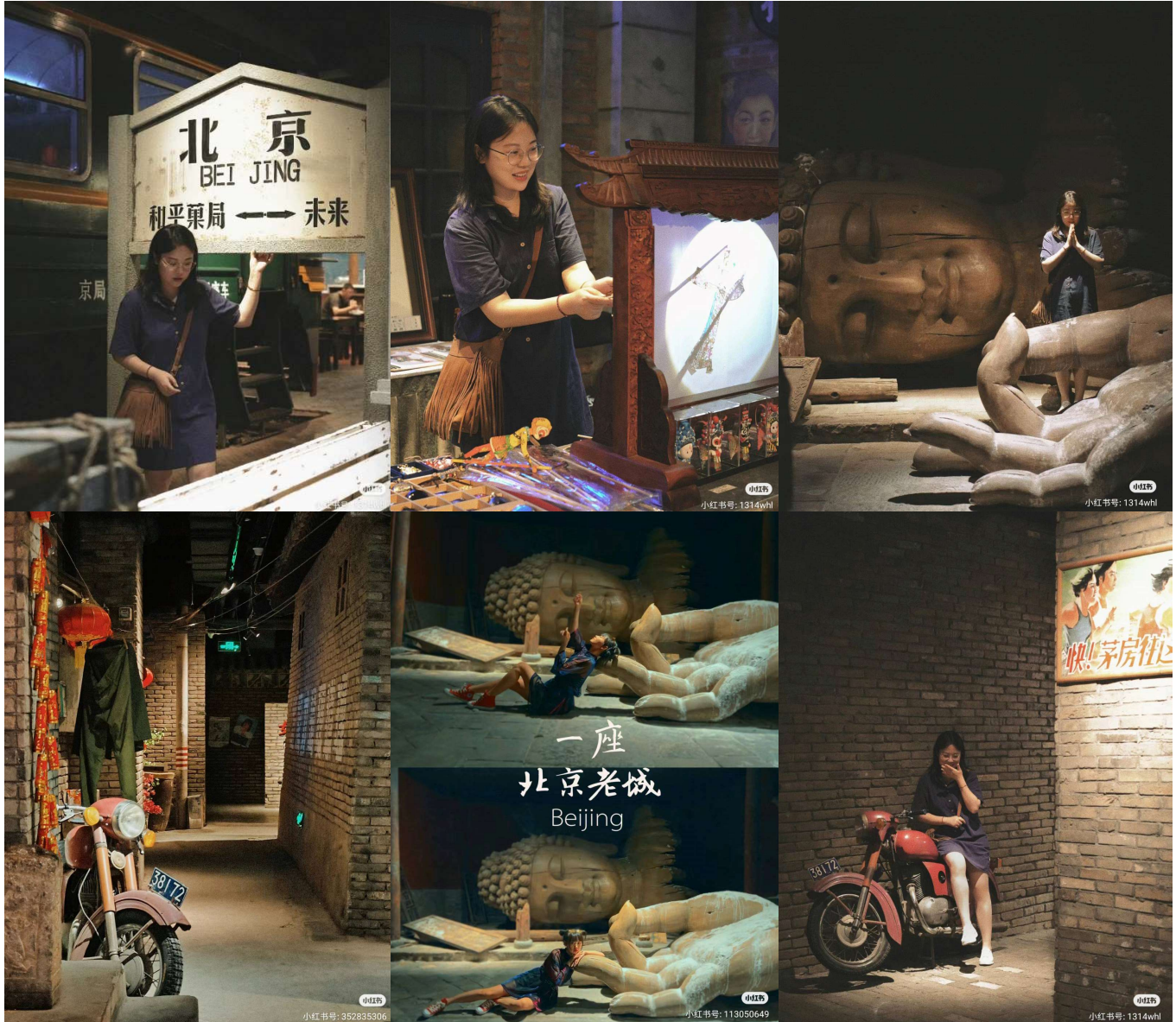
ขอบคุณเจ้าของภาพ (เครดิตตามภาพ)