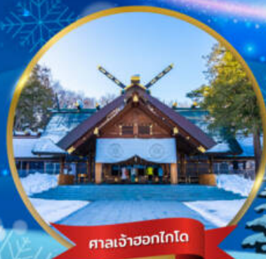
ศาลเจ้าฮอกไกโด

พักอาซาฮิคาว่า 1 คืน - โอตารุ 1 คืน - ซัปโปโร 2 คืน (ติดย่านช้อปปิ้ง)