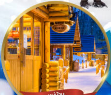
หมู่บ้าน NINGLE TERRACE

สนุกสนาน ณ ลานสกี • หมู่บ้านราเมนอาซาฮิคาว่า • หมู่บ้านนิงเกิลเทอร์เรส ขบวนพาเหรดเพนกวิน ณ สวนสัตว์อาซาฮิคาว่า • โรงงานช็อกโกแลต โอตารุ • ศาลเจ้าฮอกไกโด • พระใหญ่ HILL OF BUDDHA