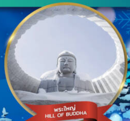
พระใหญ่ HILL OF BUDDHA