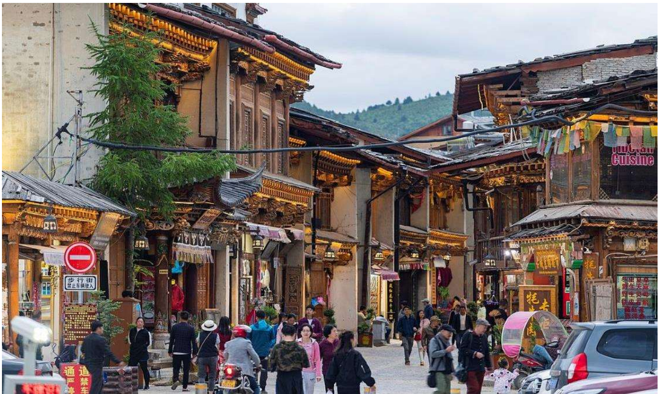
T2G-KMG07FD WINTER KUNMING คุณหมิง ต้าหลี่ ลีเจียง แชนกรีล่า ไปสุ่ยโต ภูเขาหิมะมังกรหยก 6D 5N (FD)