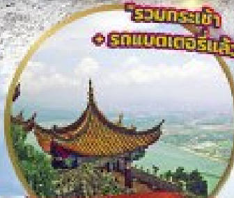
ยอดเขาชี้ชาน