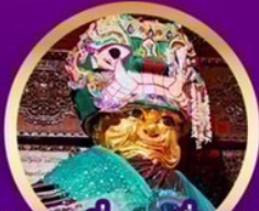
ถวายบุหรีและเครื่องบูชา แม่ยักษ์แห่งชเวดากอง