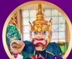
ขอพรยักษ์ 2 พี่น้อง แห่งใจ้กะसान