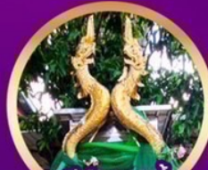
เจดีย์กลางน้ำ เยลพญา