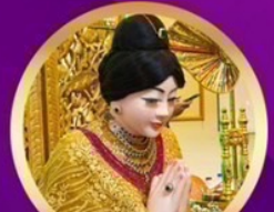
ขอพรเทพกระซิบ