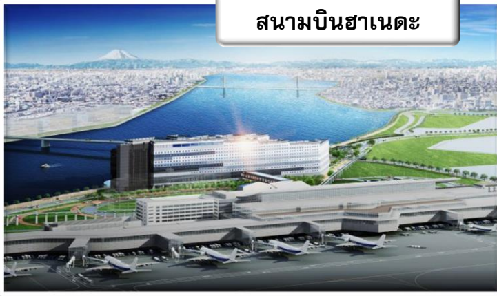
สนามบินฮาเนดะ

เวลา 23.15 น. ออกเดินทางสู่ สนามบินฟูคุโอกะ ประเทศญี่ปุ่น โดย สายการบินไทย เที่ยวบินที่ TG 682