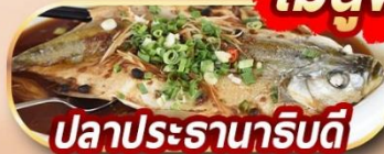
ปลาประธาราธิบดี