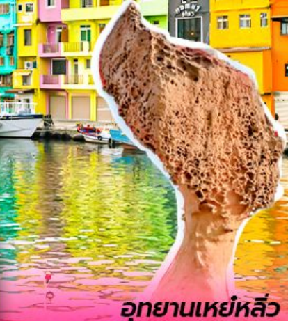
อุทยานเหยี่ยวหลิว