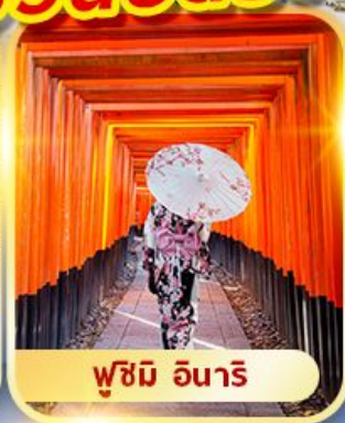
ฟูชิมิ อินาริ