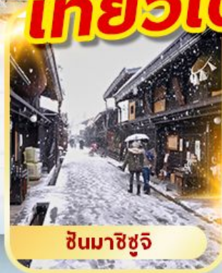
ชินมาชิซุจิ