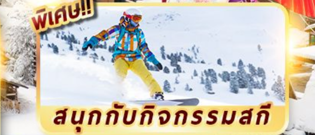
สนุกกับกิจกรรมสกี