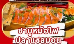
ชาบูหม้อไฟปลาแซลมอน