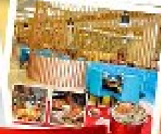
ก๊อมน้ำ + HOTPOT SEAFOOD