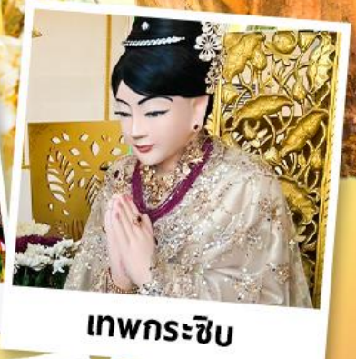
เทพกระซิบ