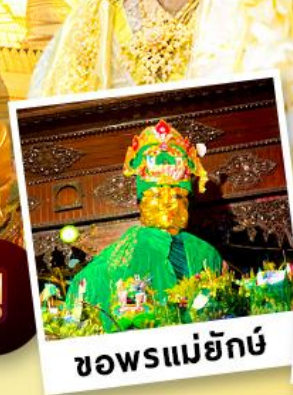
ขอพรแม่ยักย์