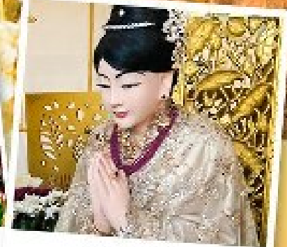
เทพกระซิบ