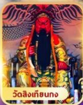
วัดลิงเกียตง