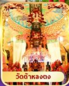
วัดต้าหลงตง