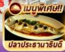
เมนูพิเศษ!! ปลาประธนาธิบดี