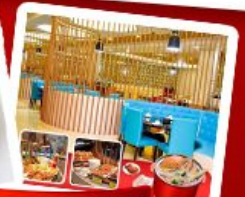
ก๊วยแม่เฒ่า + HOTPOT SEAFOOD