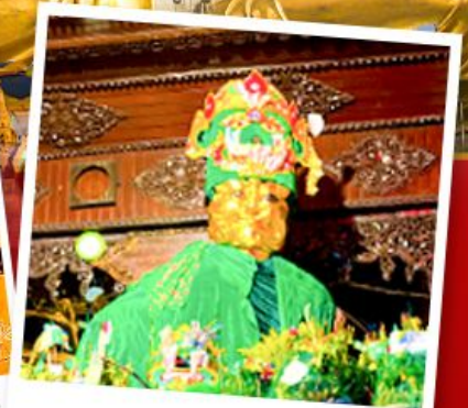
ขอพรแม่ยักย์