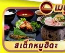
สเด็กหมูฮิดะ