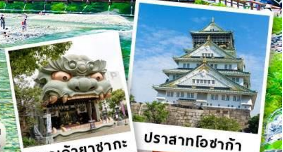
ศาลเจ้ายาซากะ