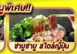
ชาบูชาบู สโตลญี่ปุ่น