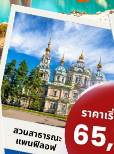
สวนสาธารณะแพนฟีลอฟ