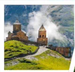
โบสถ์เกอร์เกติ