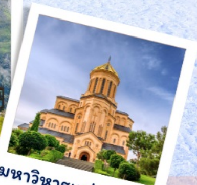
มหาวิหารแห่งทบิลีซี