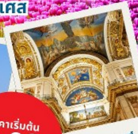
พระราชวังแวร์ซายส์