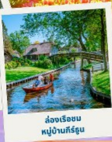
ล่องเรือชม หมู่บ้านค็ิร์ชดูน