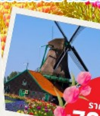
หมู่บ้านกังหันลม ซานส์ สคันส์