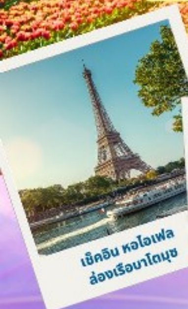
เขาคิน หอไอเฟล ล่องเรือมาโทมุซ

เทศกาลดอกไม้ เคอเคนฮอฟ 2024 เนเธอร์แลนด์ เบลเยียม ฝรั่งเศส