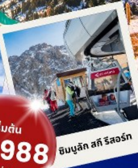
ซิมบูลิก สกี รีสอร์ท