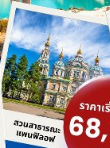
สวนสาธารณะ แพนฟีลอฟ