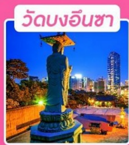
วัดบงอินซา