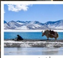
ทะเลสาบน้ำมูเซว