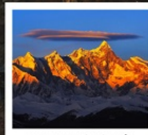
เขานานเจียปาหว่า