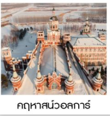
คฤหาสน์บอลการ