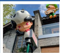
ถนนคนเดินซวยกว้างแคบ