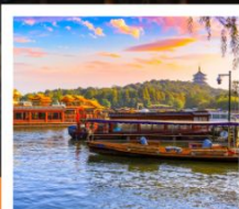
ล่องเรือทะเลสาบซีหู