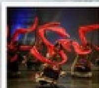
โรวี่ไท่ตง