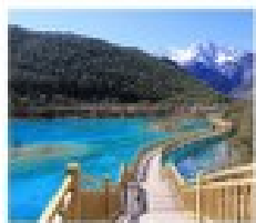
น้ำพุร้อน