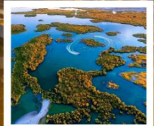
ทะเลสาบอูลุนกุ

ผ่านทางด่วนทะเลทราย S21 / ทะเลสาบอูลุนกุ / ปู่อ๋อจิน / เซาโปซา / ทุ่งหญ้าอาเหอถังโก่ตี้ / หมู่บ้านเหม่อู่ซุน / คานาสี / ทะเลสาบมังกรหลับ / ทะเลสาบเทวดา จุดชมวิวกานาสี / ศาลาชมปลา / ล่องเรือทะเลสาบคานาสี / หาดห้าสี / เมืองปีศาจ / เมืองคาลามาอี / คาลามาอี / แกรนด์แคนยอนตูซันจือ / ตลาดต้าปาจา