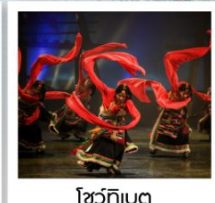
โจวจีบาต