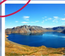
ดางไป่ซาน