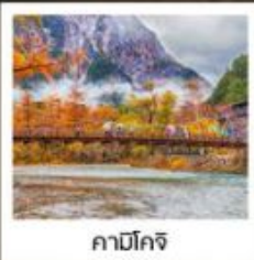
คามิโคจิ

ลิ้มรสเมนูสุดพิเศษ บุฟเฟ่ต์ซาซุไม่อื่น / ซาซุระดับพรีเมียม