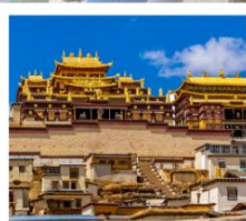
วัดลามะซงจ้านหลิง