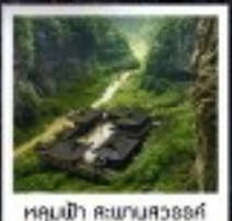
หลุมฟ้า สะพานสวรรค์