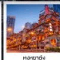
ต๋าหยาต้ง