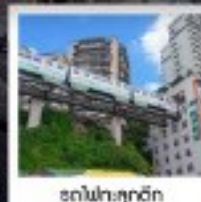
ต๋าโหล่ต๋าจู้

ทัวร์คุณภาพ ไปลงร้านช้อปปิ้ง • ไปชาย้ออฟชั่น