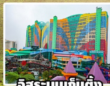
อิสระบนเก็นติ้ง