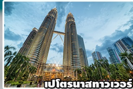
เปโตรนาสทาวเวอร์